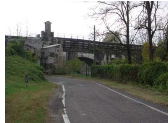
Sovrappasso idrico sul Lambro